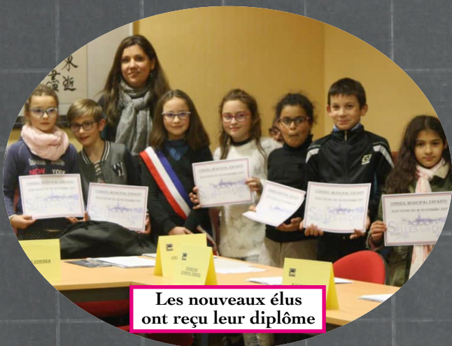
Les nouveaux élus ont reçu leur diplôme

Comme chaque année, les jeunes Sellois ont élu les membres du conseil municipal enfants. Ce mandat présente une nouveauté, le conseil municipal enfants est passé de 11 à 13 membres élus pour une durée de 2 ans. Cette année 9 postes étaient à pourvoir lors d'élections qui se sont déroulées le 16 novembre. Nous avons été présenté au Conseil Municipal "adulte" du 14 décembre.