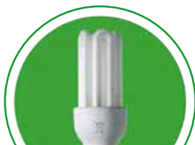
Lampe à LED