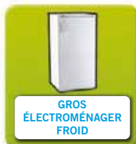
GROS ÉLECTROMÉNAGER FROID