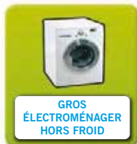
GROS ÉLECTROMÉNAGER HORS FROID