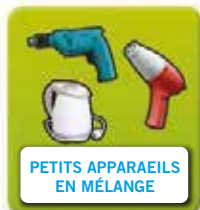
PETITS APPAREILS EN MÉLANGE

Appelés DEEE, ce sont les appareils électriques ou électroniques en fin de vie à trier selon 4 catégories. Attention : les équipements professionnels ne sont pas acceptés.